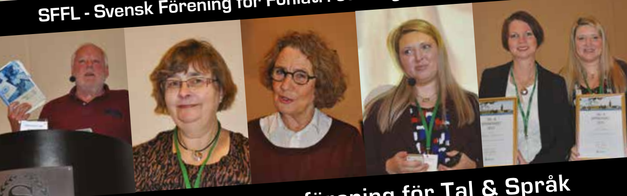
SITS - Svensk Intresseförening för Tal & Språk