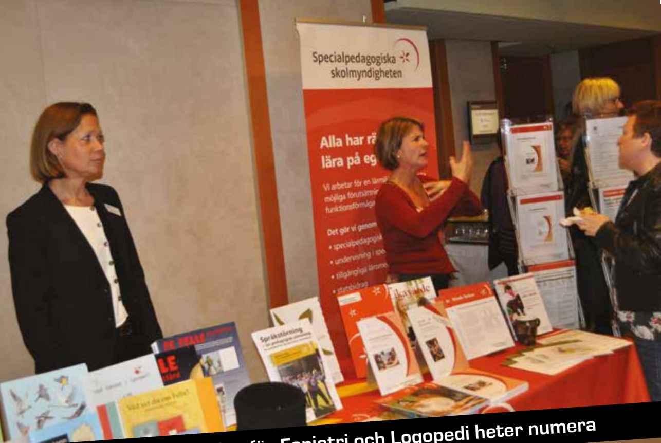
SFFL - Svensk Förening för Foniatri och Logopedi heter numera